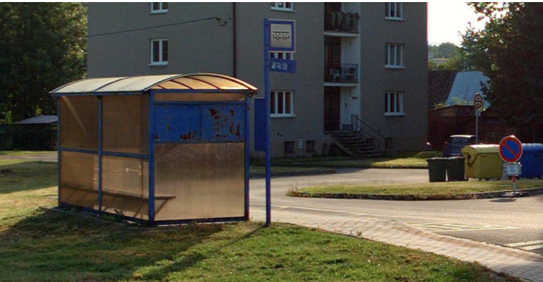
OBR. 2 – AUTOBUSOVÁ ZASTÁVKA BOČNÍ POHLED