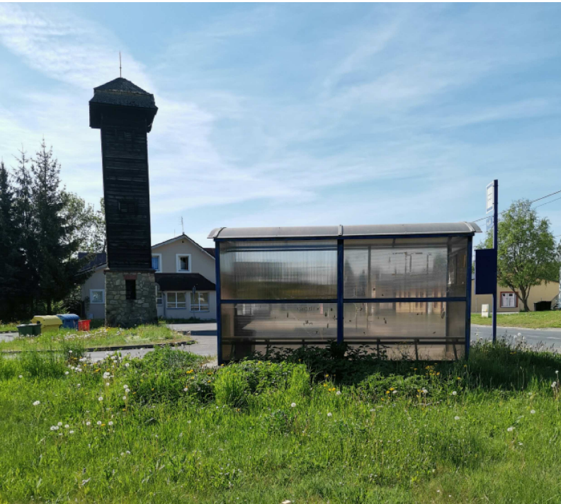
OBR. 4 – AUTOBUSOVÁ ZASTÁVKA ZADNÍ POHLED