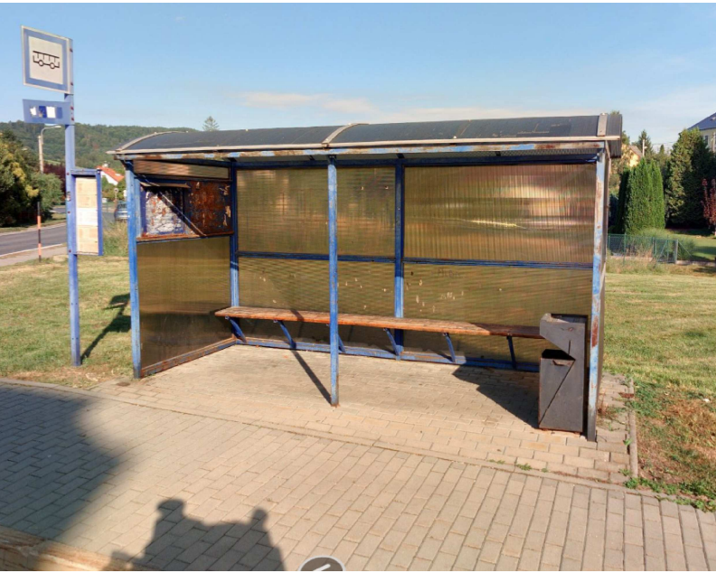
OBR. 1 – AUTOBUSOVÁ ZASTÁVKA ČELNÍ POHLED